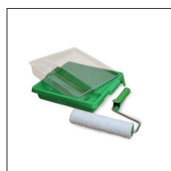
Osmo Mikrofiber roller