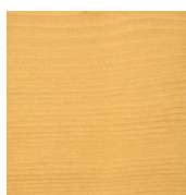
701 Ofärgad på gran

Underhåll utförs på ren, torr yta med samma produkt som användes vid grunbehandlingen. Vid reparation putsas det skadade området med finkornigt sandpapper, torkas bort det fina slipdammet. Applicera produkt mycket tunt i fiberriktning, undvik applicering i direkt solljus. Låt torka 4-6 timmar. Applicera ytterligare ett mycket tunt lager produkt över hela ytan och låt torka 12 timmar.