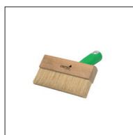
Osmo Penselborste med handtag