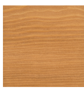
702 Lärk på gran