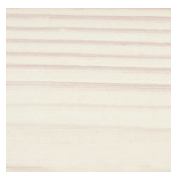
900 Vit på gran

De avbildade kulörerna är applicerade 2ggr, fotograferade och endast vägledande. Det finns alltid risk för att färgavvikelse uppkommer vid tryckning av broschyrmaterial.