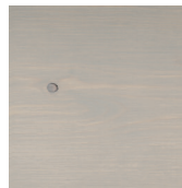
906 Pärlgrå på gran