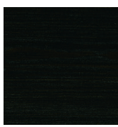
712 Ebenholts på gran