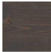
907 Kvartsgrå på gran