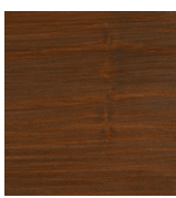
708 Teak på gran