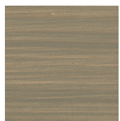
903 Basaltgrå på gran